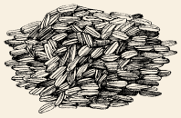
Brown Rice Protein